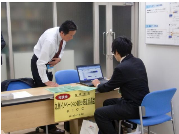
開放機器データベース検索状況